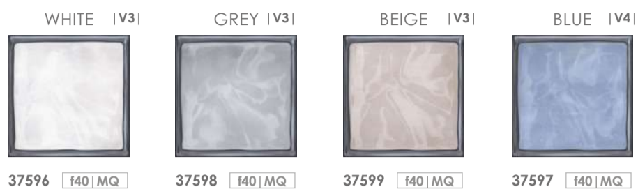
37596 f40 | MQ

gres porcellanato porcelain stoneware feinsteintzeug grès cérame