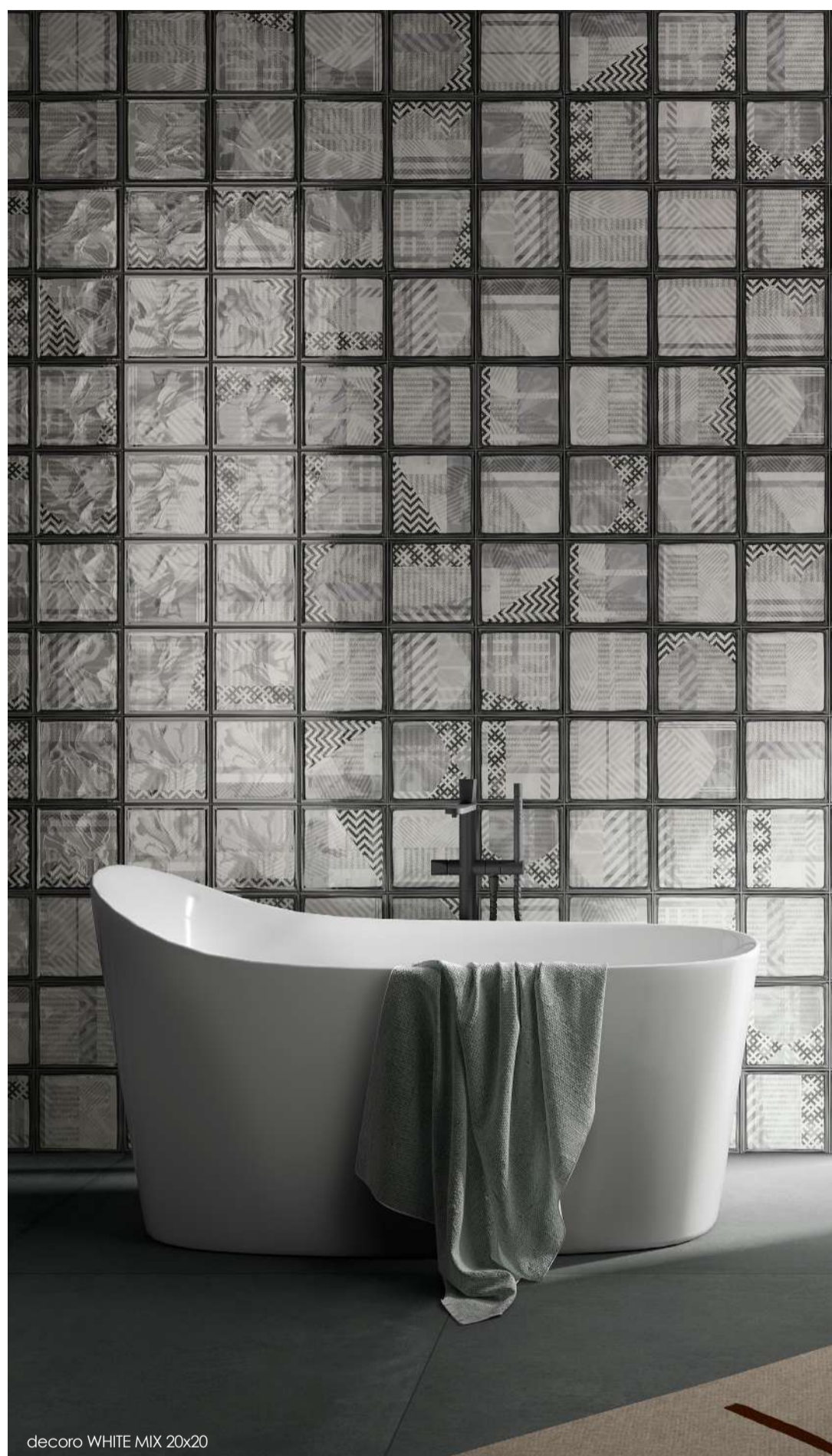
decoro WHITE MIX 20x20

gres porcellanato porcelain stoneware feinsteintzeug grès cérame